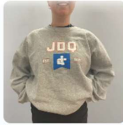
CHANDAIL À COL ROND 40,00 $CA