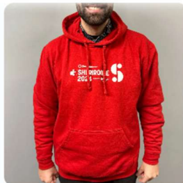
CHANDAIL À CAPUCHE ADULTE 45,00 $CA