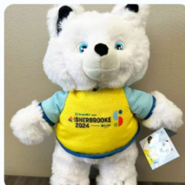
PELUCHE DE RAFALE 25,00 $CA