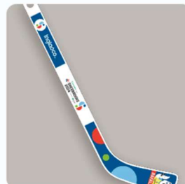
MINI HOCKEY 8,00 $CA