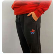
PANTALON EN MOLLETON 45,00 $CA