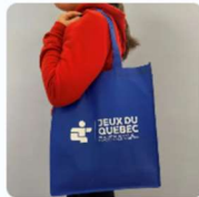
SAC RÉUTILISABLE 3,00 $CA