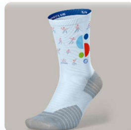
CHAUSSETTES 25,00 $CA