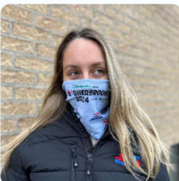
CACHE-COU UNE ÉPAISSEUR 10,00 $CA