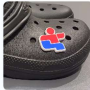
ÉPINGLETTES CROCS 5,00 $CA