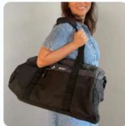
SAC DE SPORT 20,00 $CA