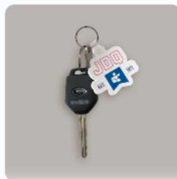
BOYFEE - JDO