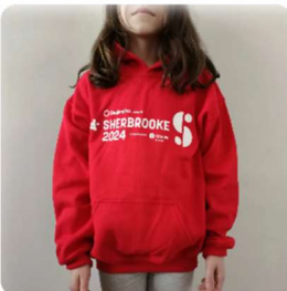
CHANDAIL À CAPUCHE JUNIOR 40,00 $CA