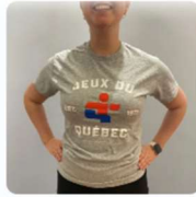
T-SHIRT GRIS 20,00 $CA - 25,00 $CA